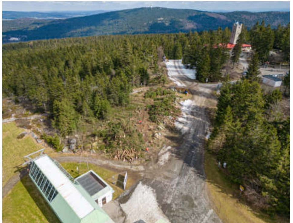
Hier entsteht die neue Pistenanbindung am Gipfel des Ochsenkopfs

den Bau einer Anbindung von der Nordpiste zur Mittelstation und von dort zurück auf die Skipiste vor. Zusätzlich muss auch die Breite der Lifttrasse an die erneuerte Gondelbahn angepasst werden. Zugleich werden alle kranken oder faulen Bäume entfernt, um die Sicherheit für den Seilbahnbetrieb zu gewährleisten.