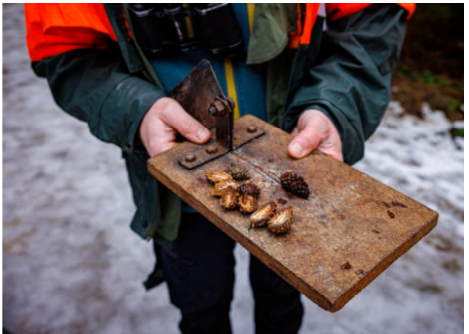
Aufgeschnittene Spirkenzapfen mit Samenkörnern

binden und später verzögert abgeben. Durch diesen Schutz vor Hochwasser helfen sie also auch direkt den Menschen.