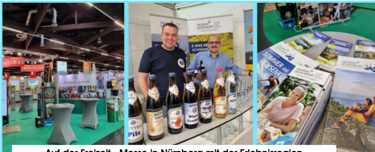
Auf der Freizeit - Messe in Nürnberg mit der Erlebnisregion Ochsenkopf—hervorragend besucht! Beste Werbung für die Region.