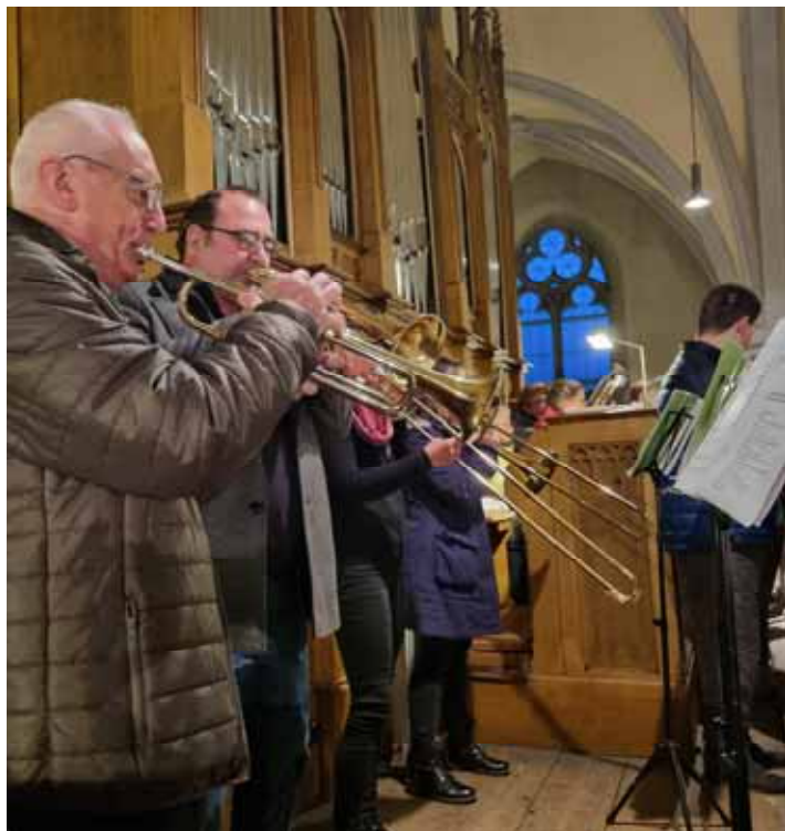
55 Jahre Posaunenchor Bischofsgrün 1968 -2023