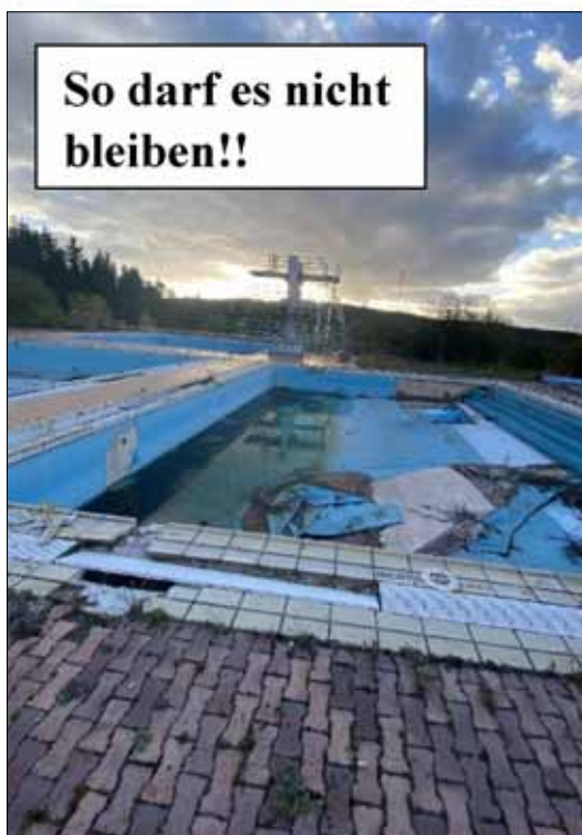
Oktober 2023

Das Besondere an diesem Sponsoring ist für uns, neben dem finanziellen Aspekt, die damit ausgedrückte Verbundenheit zu Bischofsgrün und die Motivation für unser Ziel, die Wiedereröffnung unseres Freibads, zu bestärken.