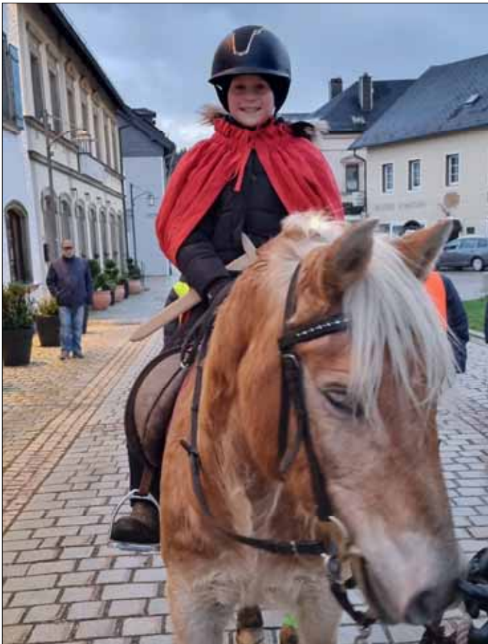
Viele herzliche Grüße von Sankt Martina.